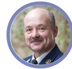
ANDRÉ DESENFANTS Directeur général de la police administrative

“Un bel exemple de collaboration intégrée : les trois Centres régionaux de traitement ! En 2018, 93 zones de police ont coopéré avec un CRT, pour un total d'un peu plus de 600 000 perceptions immédiates/procès-verbaux traités par les CRT à leur profit.”